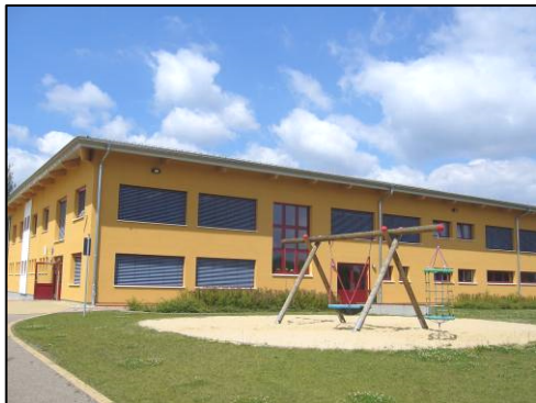
Serbska zakładna šula Ralbicy